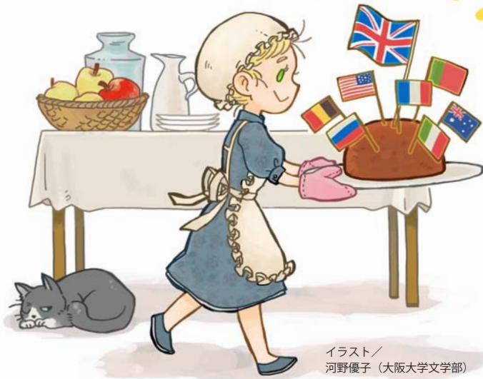
イラスト / 河野優子 (大阪大学文学部)