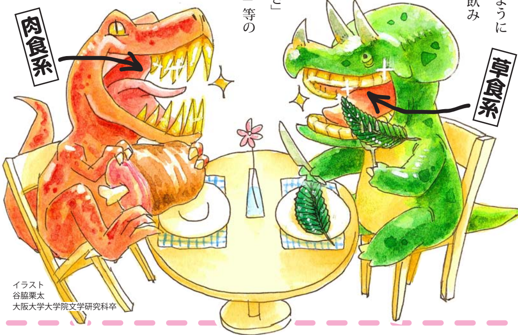
イラスト 谷脇栗太 大阪大学大学院文学研究科卒