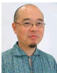
伊東信宏 / 大阪大学大学院文学研究科・教授。音楽学者。ハンガリー、ルーマニアなど中東欧の音楽史・民俗音楽などを研究している。著書に『中東欧音楽の回路』(岩波書店、2009年、サントリー学芸賞)など。朝日新聞、NHK-FMなどで解説、批評を担当。

モーツァルトの「トルコ行進曲」について考え、トルコ・ライスを作って食べながら、それがトルコの何を表象していたかを考えてみましょう。