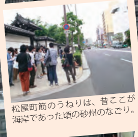
松屋町筋のうねりは、昔ここが海岸であった頃の砂州のなごり。

■上町断層とは／大阪府北部の豊中市から大阪市内の上町台地の西の端を通り、大阪府南部の岸和田市にまで続く活断層。日本の活断層の中では地震発生確率が(相対的に)高いグループに属する。