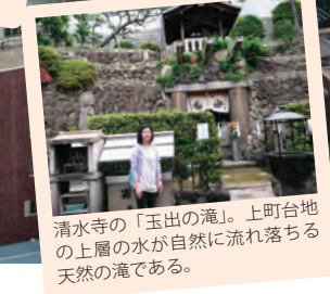
清水寺の「玉出の滝」。上町台地の土層の水が自然に流れ落ちる天然の滝である。

どうして日本では大地震が頻発するのでしょうか？この問いに答えるために、まずは地球の中がどうなっているのかを理解しましょう。46億年前の誕生から今日までも、地球はずっと生き続けているのです。今回の講義では、地震発生のメカニズムの簡単な説明に加え、これから発生を控えている東海・東南海・南海地震について、我々はどこまで理解できているのかを解説し、その防災対策についてお話しします。