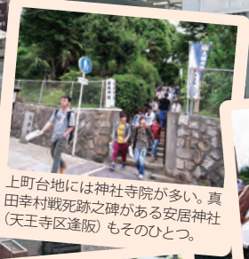
上町台地には神社寺院が多い。真田幸村戦死跡之碑がある安居神社(天王寺区逢阪)もそのひとつ。