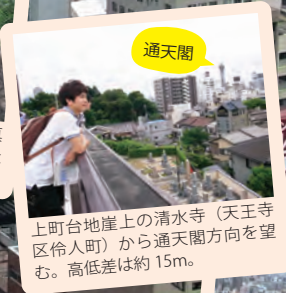
上町台地崖上の清水寺(天王寺区伶人町)から通天閣方向を望む。高低差は約15m。

どうして日本では大地震が頻発するのでしょうか？この問いに答えるために、まずは地球の中がどうなっているのかを理解しましょう。46億年前の誕生から今日までも、地球はずっと生き続けているのです。今回の講義では、地震発生のメカニズムの簡単な説明に加え、これから発生を控えている東海・東南海・南海地震について、我々はどこまで理解できているのかを解説し、その防災対策についてお話しします。