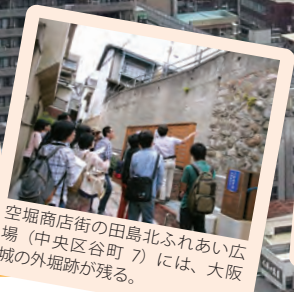
空堀商店街の田島北ふれあい広場(中央区谷町7)には、大阪城の外堀跡が残る。