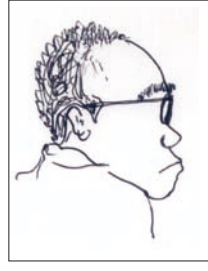
イラスト/谷脇聖太 (大阪大学大学院文学研究科卒)

なかの・とおる 「いろいろな細胞は どうやってできてくるのか」 についての研究を生業とする 大阪大学医学