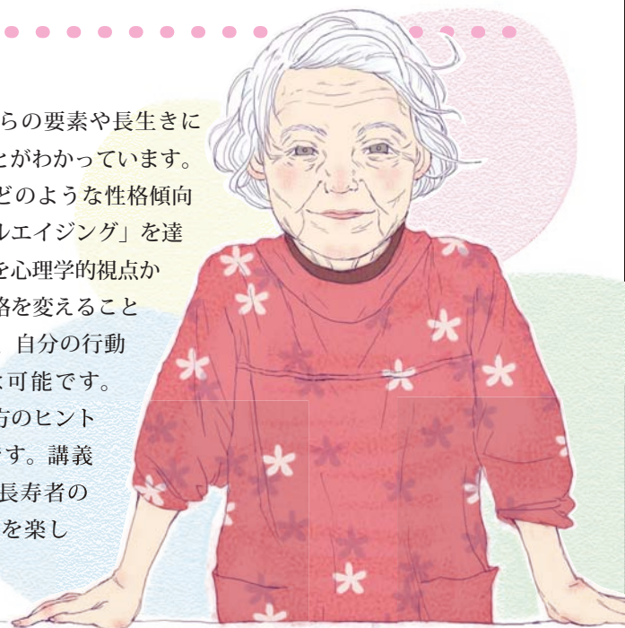
イラスト/中川 威 (大阪大学大学院人間科学研究科・助教)

本講座では、どのような性格傾向が「サクセスフルエイジング」を達成しやすいのかを心理学的視点から考えます。性格を変えることは難しいですが、自分の行動を変えることは可能です。みなさんの生き方のヒントになれば幸いです。講義の後は、健康な長寿者の多い沖縄の料理を楽しみましょう。