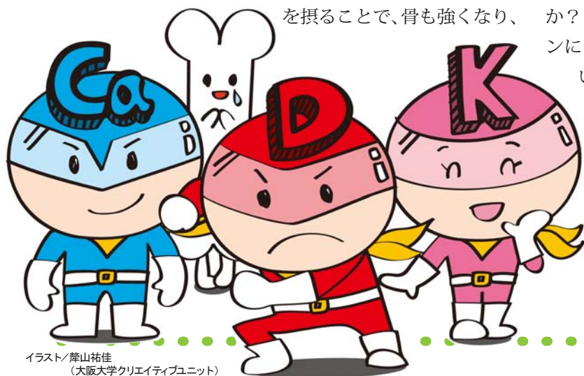
イラスト/藤山祐佳 (大阪大学クリエイティブユニット)

免疫力もアップします。でもこれらのビタミンがどうやって効いているのか、皆さんはご存じですか？ 実は古くから体に良いとされてきたビタミンにも、その働き方はつい最近までよく分かっていなかったものが多くあります。今回の講師は、特殊な方法で生きた体の中で骨や免疫の様子を見ることに成功し、これによってビタミンの本当の働きを明らかにしました。さあ、皆さんも、ビタミン豊富な食事とともに、この「生体内ライブカメラ」で、体の中の小宇宙を旅してみませんか。そして、目と舌で、ビタミンの働きを堪能しましょう。