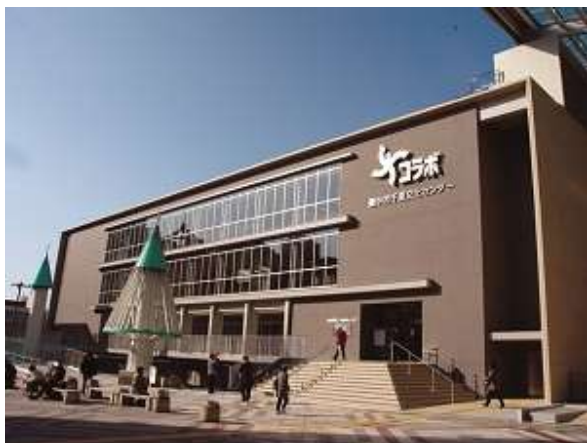
千里文化センター「コラボ」外観