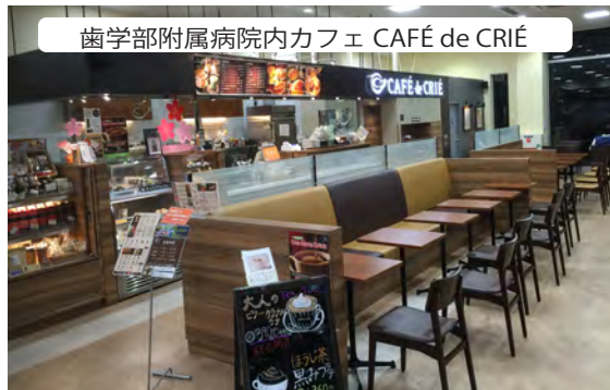
歯学部附属病院内カフェ CAFÉ de CRIÉ